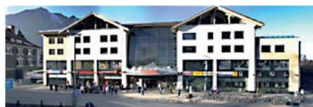
ILG Fonds Nr. 37 - „GEP“ Garmisch-Partenkirchen

Mit der aktuellen Neuinvestition beteiligt sich das Fondsmanagement an drei neu errichteten strategischen Handelsimmobilien im Süden Deutschlands. Die Standorte in Unterschleißheim (Großraum München), Geislingen a.d.S. (Region Stuttgart) und Garmisch-Partenkirchen zeichnen sich durch eine insgesamt überdurchschnittliche einzelhandelsrelevante Kaufkraft, eine stabile Bevölkerungssituation und geringe Arbeitslosigkeit aus. Ankermieter sind u. a. Aldi, Rewe, Edeka, Lidl, Tengelmann, dm, C&A, Rossmann. Die Diversifikation wird mit über 60 Mietverträgen an den drei Standorten in besonderer Weise gewährleistet.